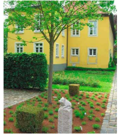
Das Schweinchen am Weg zum Wasserschloss, in dem die HVG-Verwaltung untergebracht ist, erinnert an den Bauernhof, der zuvor das Landgut in Datteln bewirtschaftete.

Viele Wohneigentümer haben keine genauen Vorstellungen über Verteilung, Pflegeintensität, Zuständigkeiten und tatsächliche Nutzung ihrer Grünflächen. Oftmals ist ihnen nicht bekannt, welchen Kostenanteil eine Wohneinheit am Gesamtbudget hat. „Wir hatten vor drei Jahren bereits einen hohen Anteil an Pflegeflächen zu managen. Dabei trat oft das Problem auf, dass Leistungsverzeichnisse nicht zu unseren Flächen passten. Es handelte sich um