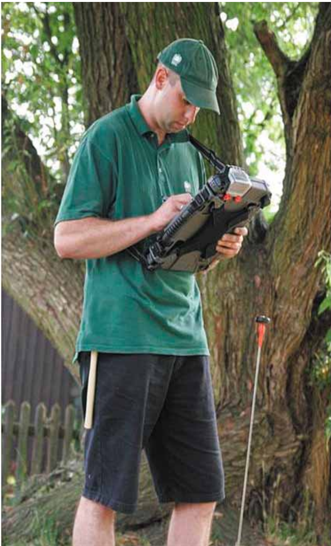
Die Baumkontrolleure sind mit modernen Tablet-PCs ausgestattet.