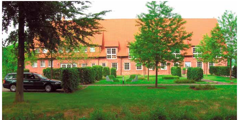
In der schmuck renovierten, ehemaligen Scheune des Gutshofes sind die Fachabteilungen des grünen Kompetenzzentrums untergebracht.

Die HVG hat neben dem Einsatz von Green-GaLa ein eigenes Grünflächen-Informationssystem (Grün:FM) entwickelt. Die Verknüpfung zwischen beiden Programmen funktioniert über das digitale Tagesberichtswesen. Hier werden alle Stundenberichte der Mitarbeiter draußen vor Ort erfasst, in welchen Wohneinheiten sie welche Pflegemaßnahmen ausgeführt haben. Diese Daten werden dann in Verknüpfung mit Green-GaLa der Lohnbuchhaltung und Kalkulation zur Verfügung gestellt. Hier lassen sich dann die tatsächlich entstandenen Kosten ermitteln. „Zurzeit sind wir dabei, zusammen mit der Firma Greenware ein durchgehendes digitales Tagesberichtswesen aufzubauen. Dazu wurden unsere Vorarbeiter, welche die Tagesberichte für ihre Mitarbeiter schreiben, mit Laptops ausgestattet. Künftig werden sie über das Programm vorsortiert die Vorgaben nur für diejenigen Projekte erhalten, für die sie verantwortlich sind. Die auf dem Lap-