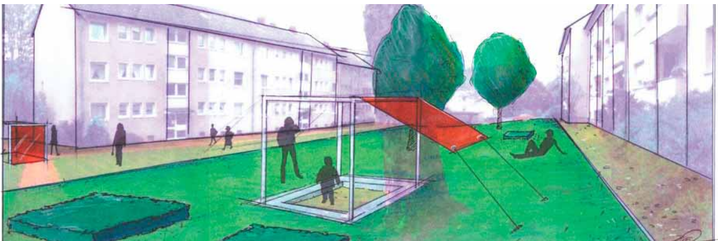
Die Abteilung Landschaftsarchitektur im Haus Vogelsang macht eigene Planungsentwürfe für Neu- und Umbauten von Freiflächen. | Grafik: HVG.