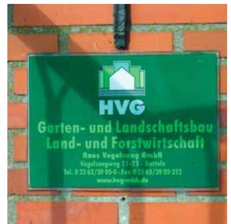
Oben: Die Haus Vogelsang GmbH managt allein 7 Millionen Quadratmeter Wohnumfeld – hauptsächlich in Nordrhein-Westfalen.

Links: Gerald Müller (links) und Markus Kissenbeck können statistisch belegen, dass 80% der Mieter einer Wohnanlage die Außenanlagen als das Wichtigste in ihrem Wohnumfeld betrachten.