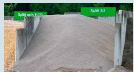
Schüttgüter aufgeräumt: Auf dem Betriebshof werden neben Baustoffen, Schachtringen, Zisternen, Findlingen, Brunnen etc. auch Schüttgüter in neuen Boxen vorgehalten.