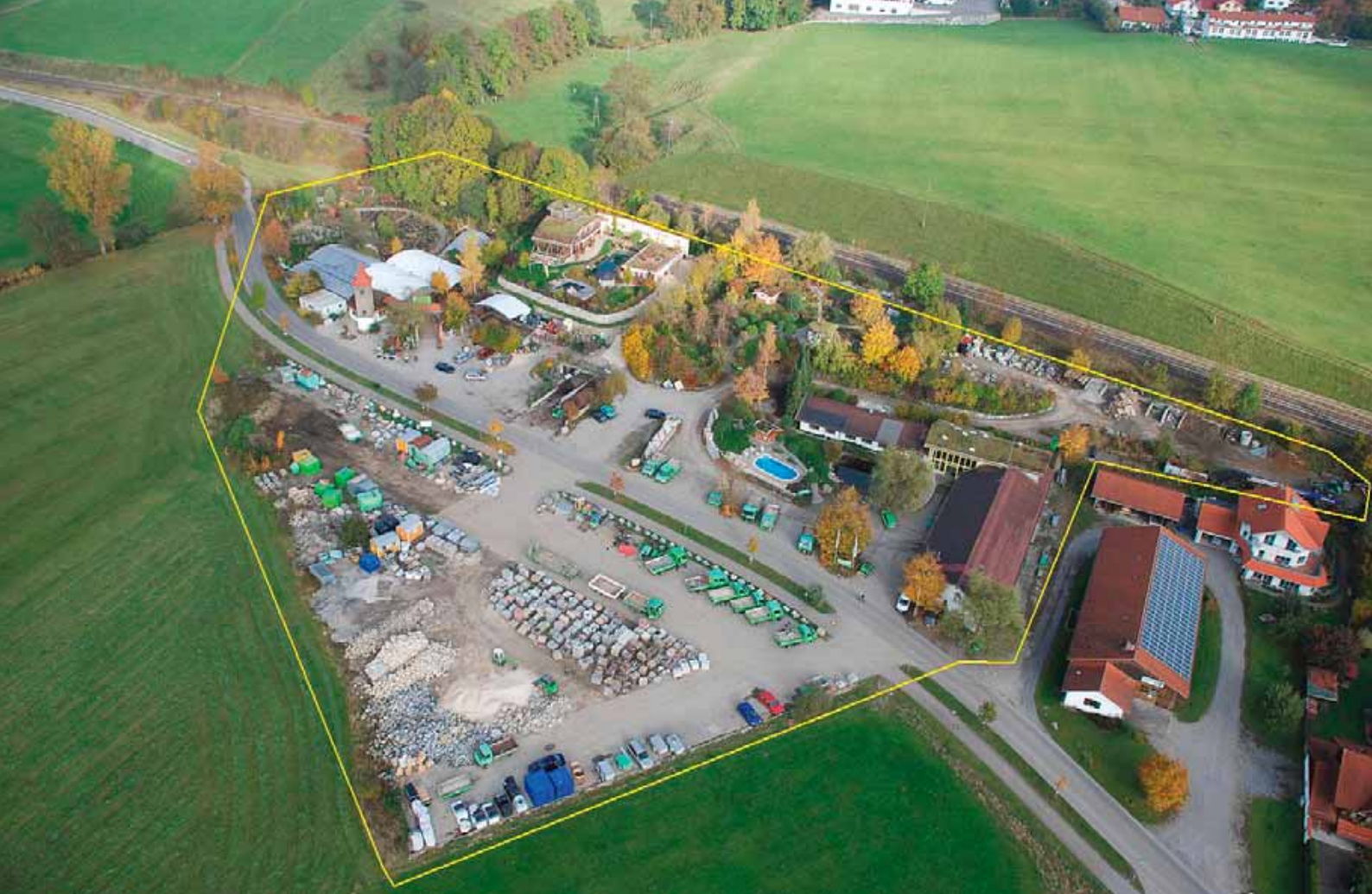
GaLaBau-Eldorado im Allgäu: Der Betriebshof in Wildpoldsried auf rund 2 Hektar ist nicht nur aus der Vogelperspektive, sondern auch im Detail interessant. Schüttgutboxen und Waage waren zum Aufnahmezeitpunkt noch nicht installiert.