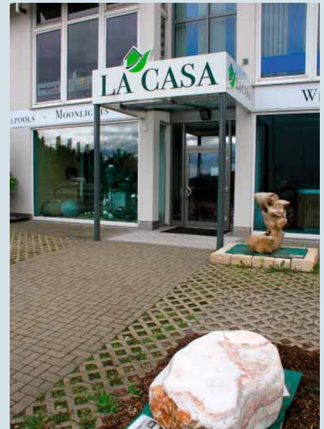
Neue Marketingwege: Mit „La Casa“, einer gemeinsam mit einem Wintergartenbauer betriebenen Verkaufsausstellung, ist der GaLaBau-Betrieb auch in Kempten präsent.

Infos: www.greenware-id.de , www.schellheimer.de