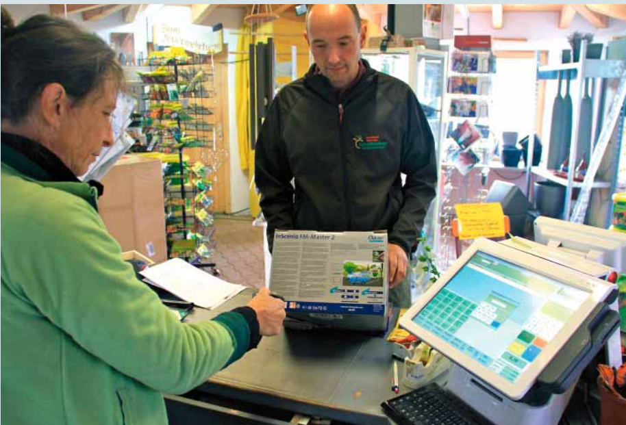
Waren mit Scanner erfassen: Mit dem Kassensystem von Greenware können die Artikel im Gartencenter mit dem Barcode-Lesegerät bequem erfasst werden.

Klasse findet er auch die Möglichkeit, dass seine Bauleiter nun über das so genannte „Remote Desktop“ von überall her per Internet auf den Terminalserver im Betrieb zugreifen und so mit dem Branchenprogramm arbeiten können, als wären sie im Büro. „Das ist schon genial, was die moderne Servertechnik hier ermöglicht. Gerade weil unsere Kolonnen oft auf weit entfernten Baustellen im Einsatz sind, ist