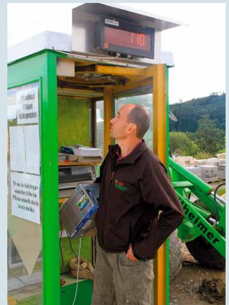
Liefermengen im Griff: Für die Optimierung der Logistik auf dem Betriebshof wurde extra eine Lkw-Waage mit Digitalanzeiger installiert.