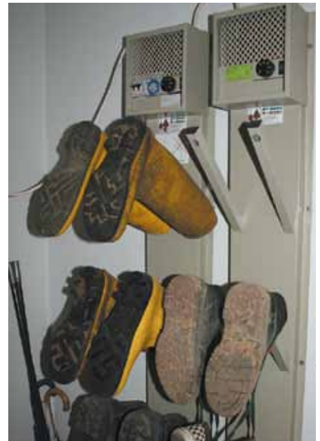
Die Schuhtrockner im Mitarbeiter-Aufenthaltsbereich bewirken eine langsame und daher rissfreie Trocknung der Arbeitsschuhe.