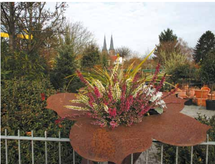
Das Gonsenheimer Pflanzcenter wird auch dank des milden Klimas in der oberrheinischen Tiefebene rund um's Jahr frequentiert.

Seit Kurzem verfügt die Firma darüber hinaus über ein mobiles Zeiterfassungssystem, das über Mobilfunk betrieben wird. Jeder Polier erfasst damit auf seinem Handy die Arbeitsstunden der Mitarbeiter, die dann drahtlos im Betrieb eintreffen und über das Programm ausgewertet werden. Von dort gehen die Daten dann in die Lohnbuchhaltung, die im Hause Stinner selbst vorgenommen wird. Sobald die Schnittstelle zur Branchensoftware eingerichtet ist, können auch die auf der Baustelle eingesetzten Maschinen auf diese Weise registriert werden. Der Versand von Baustellenfotos, die mit dem Handy zur Dokumentation der Baustellenabläufe vor Ort aufgenommen werden, wird dann ebenfalls möglich sein.