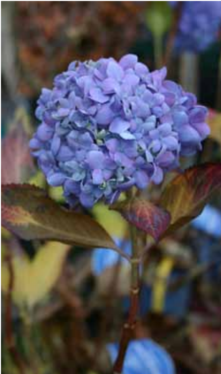
Diese Gartenhortensie aus der ‚Endless Summer‘ Collection blüht sogar noch spät im November.

muss er natürlich neu kalkulieren. Das trifft auch zu, wenn sich eine Leistungsangabe verändert und er andere Zeitvorgaben festlegen muss.