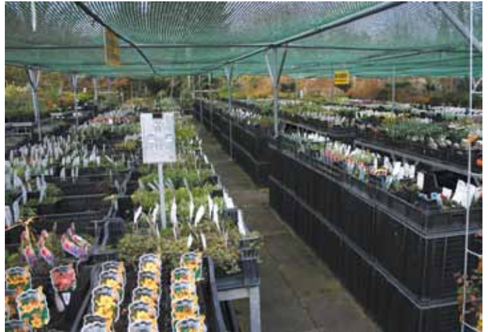
Das Gonsenheimer Pflanzencenter ist in der Region Mainz besonders für seine reichhaltige Staudenauswahl bekannt.