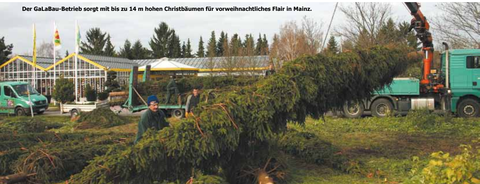
Der GaLaBau-Betrieb sorgt mit bis zu 14 m hohen Christbäumen für vorweihnachtliches Flair in Mainz.

ten Standarddaten. Wenn Anfragen von Architekten kommen, die früheren Bauvorhaben ähneln, kann er sich bei der Vorkalkulation die Angebotsposten des früheren Angebots vom zweiten Bildschirm auf den ersten Bildschirm in das jetzt zu kalkulierende Angebot einfach herüberziehen. „Das Arbeiten mit zwei Bildschirmen erleichtert mir die Kalkulation enorm. Bei umfangreichen Angeboten kann ich manchmal 90% der Posten aus vorhergehenden Angeboten übernehmen,“ erläutert der GaLaBauer bei der Demonstration seiner Vorgehensweise. Jetzt ruft er die frühere Kalkulation auf, sucht sich im Text die entsprechende Passage, kopiert seine Vorgaben und zieht sie einfach ins neue Angebot hinein. Im Nu wird anhand der neu eingegebenen Menge der aktuelle Preis berechnet. Er hat dabei auf seinen beiden Bildschirmen immer beide Vorgänge vor Augen. Wenn Posten auftreten, die er vorher noch nicht hatte,